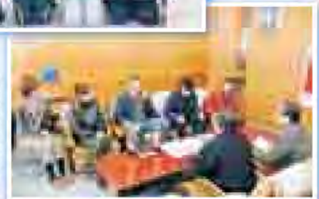
大会の結果報告に 役場に来庁

その他にもぜひ紹介してほしいという情報がありましたら、下記に問い合わせください。