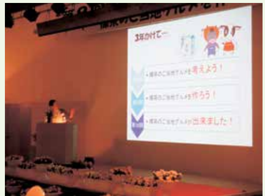
昨年度の食のつどい

■申し込み・問い合わせ／役場農林課農業企画係 (☎番窓☎485-2111内線242)、JAしべちゃ農業振興課 (☎485-2125)、釧路農業改良普及センター (☎485-2514)