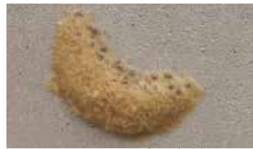
マイマイガの卵塊