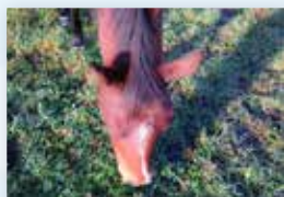
今秋、道東ならではの、多彩で魅力的な馬たちに出会う旅に出かけませんか。

まで今後のさまざまな展開の最初のトライアルです。で、参加者のニーズや評価をしっかりと確認し、次につなげていきたいと思っています。結果については、次月以降に改めてご報告いたします。 「道東ホースタウン」プロジェクトの取り組みについては、「馬ライフ」という乗馬専門雑誌にも掲載されましたが、標茶町と道東馬の魅力が良く伝わる内容になっています。今後、いろいろな機会を活用し広報にも注力していきます。