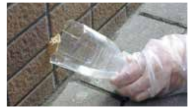
ペットボトルを使った駆除