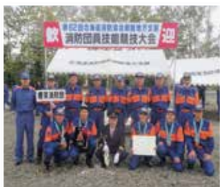
消防ポンプ自動車の第3位 第3分団(磯分内)

その結果、第1分団は健闘しましたが惜しくも入賞とはなりません。第3分団は第3位の成績で4年連続入賞となる好成績を収めました。大会出場にあたり皆さんからご支援・ご声援を頂き、誠にありがとうございました。