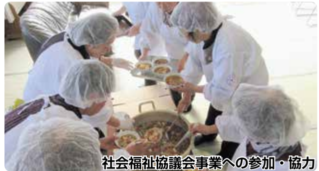
社会福祉協議会事業への参加・協力

■ 申し込み・問い合わせ / 標茶町赤十字奉仕団事務局 役場保健福祉課社会福祉係（1階④番窓口 ☎485-2111 内線133）