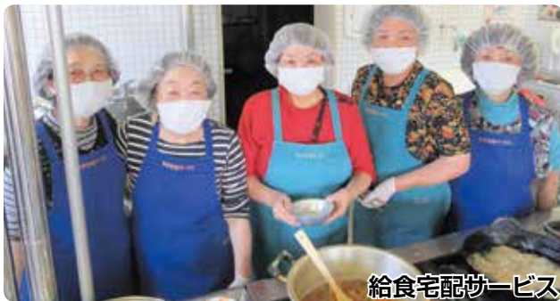
給食宅配サービス