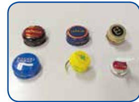
缶類のふた・瓶類のキャップ