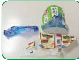
ペットボトルのキャップ・ラベル ペットボトルから外して 「プラスチック類」へ