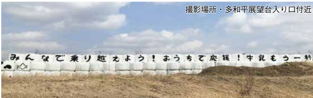
撮影場所・多和平展望台入り口付近