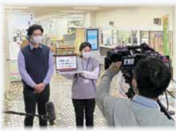
「わがまちニュース」撮影の様子

近況報告としては、1年を通して放送されるNHK札幌の「北海道スタジオム秋の陣」で標茶町代表として番組に出演したほか、同釧路放送局の「わがまちニュース」でも「北海道標茶町地域おこし」のYouTubeチャンネルを取り上げていただきました。