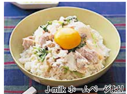
J-milk ホームページより