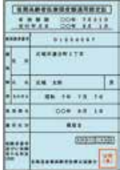
限度証 (限度額適用認定証)

引き続き減額認定証と限度証の交付対象に該当する方は、保険証と合わせて郵送します。新たに必要となる方は、交付要件に該当することを確認の上、役場住民課年金保険係へ申請してください。