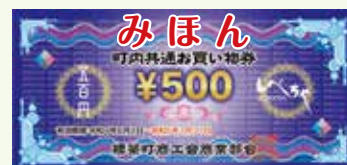
お買い物券（対象店舗で利用可）