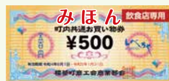
お買い物券（飲食店専用）

※「牛乳贈答券」で購入できる商品は、パッケージ品質表示部分の種類別名称記入欄に「牛乳」「成分調整牛乳」「低脂肪牛乳」「無脂肪牛乳」の記載がある商品に限ります。