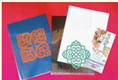
ワークショップ 「アイヌ文様のオリジナルクリアファイル製作体験」