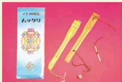
ワークショップ 「ムックリ製作体験」