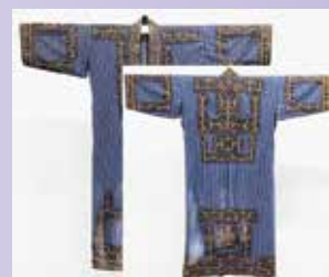
「標茶町博物館所蔵のアイヌ文様衣装」

日 時 10月14日(金)、午後1時～10月21日(金)、午後1時まで 集 合 標茶町博物館ニタイ・ト 観 覧 料 無料