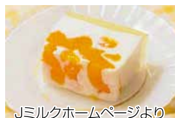
Jミルクホームページより