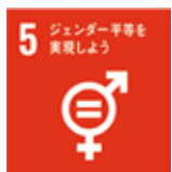
5 ジェンダー平等を実現しよう