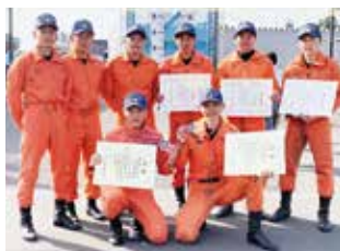
標茶消防署員（中央から左4人）