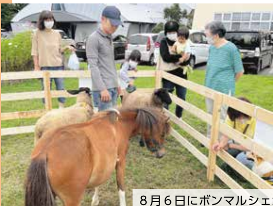
8月6日にボンマルシェが開発センターで開催されました。