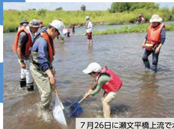
7月26日に瀬文平橋上流で水辺の楽校祭が開催されました。