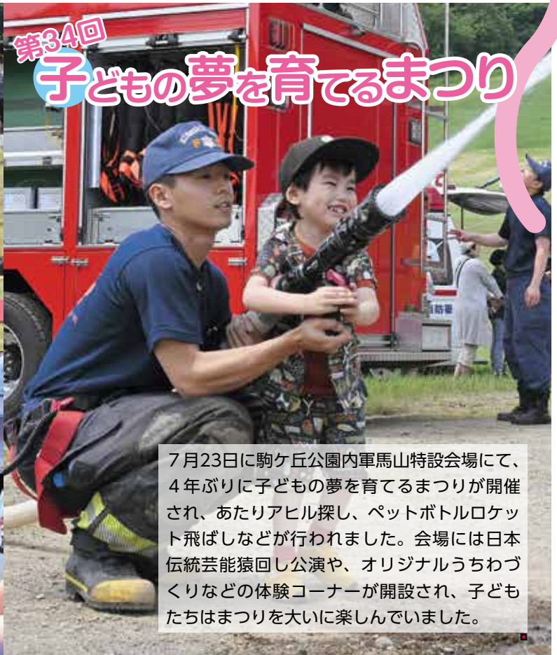
7月23日に駒ヶ丘公園内軍馬山特設会場にて、4年ぶりに子どもの夢を育てるまつりが開催され、あたりアヒル探し、ペットボトルロケット飛ばしなどが行われました。会場には日本伝統芸能猿回し公演や、オリジナルうちわづくりなどの体験コーナーが開設され、子どもたちはまつりを大いに楽しんでいました。