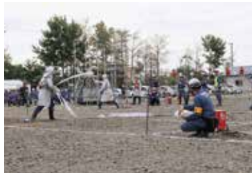
小型ポンプの部、 第1・2分団競技中の様子▶

結果は、健闘しましたが惜しくも入賞とはなりません。大会に向けて約半月に亘り汗を流した選手の方々、本当にお疲れ様でした。また、大会出場にあたりみなさんからのご支援やご声援を頂き、誠にありがとうございました。