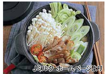
Jミルク ホームページより