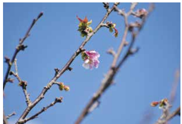
「早秋のチシマザクラ」 G.Yさんの作品