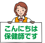
こんにちは 保健師です

みなさんは呼吸器感染症を引き起こすウイルスで最近発見された「ヒトメタニューモウイルス」をご存じでしょうか。2001年にオランダの研究チームにより発見されましたが、これは新種のウイルスではなく、以前から世界にあり技術の進歩で発見にたつたものです。