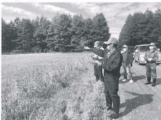
農地パトロールの様子

農業委員会では毎年、遊休農地の発生防止・解消のため、農地の利用の状況について調査・把握を行っています。特に贈与税、不動産取得税の納税猶予を受けている農地について重点的に調査を行い、適正に管理されていると確認をいたしました。