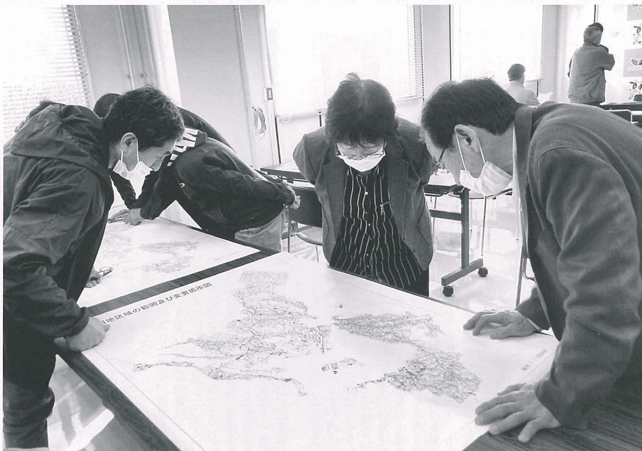
— 標茶町農業振興地域整備計画全体見直しに係る事前説明会の様子 — (5年に1度の見直しにあたり、役場中会議室にて変更箇所を確認しました。)