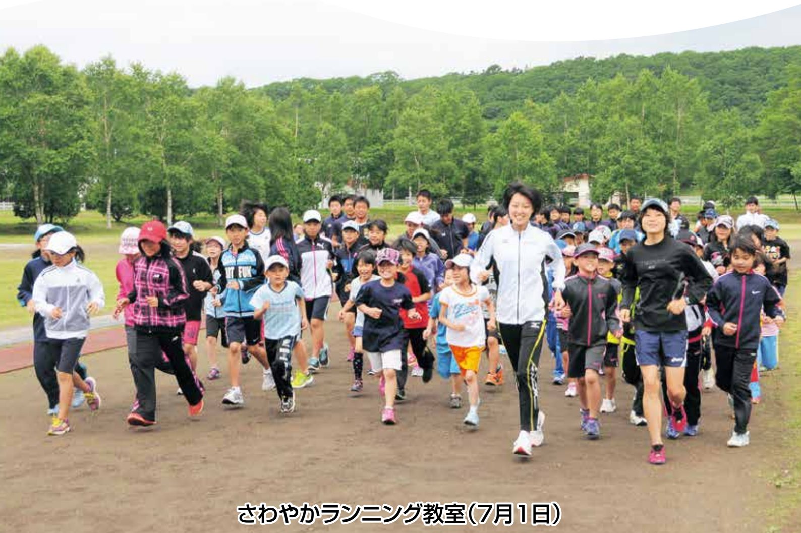
さわやかランニング教室(7月1日)