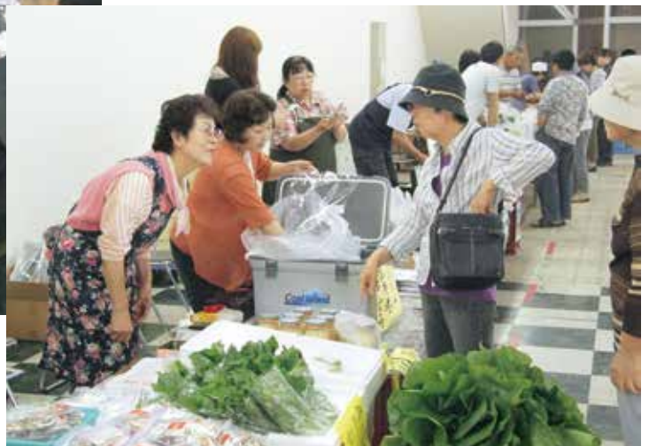
毎回盛況な「うまいもん発見市場」(6月22日)