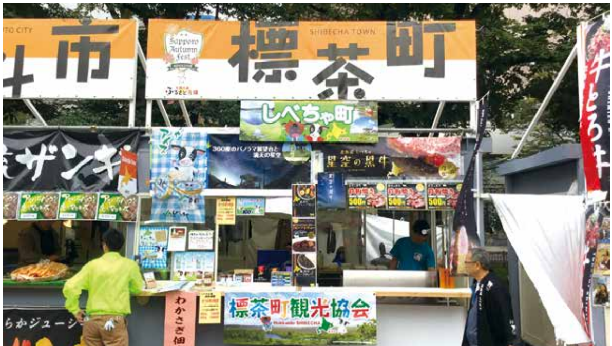
— さっぽろオータムフェスト2017 (9/28~30) 参加 —