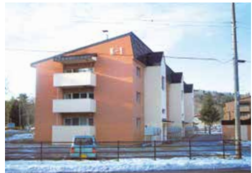
改修された川上公住

答 川上公住入居者の仮移転が5月から始まり、11月1日に川上公住に居住されている方の内覧会を実施し意見要望を受け、設計担当との情報共有のものと対応に向け協議を重ねており、来年度予定の棟から反映できる項目は見直しを進めている。