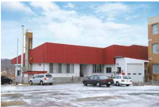
早期改築が望まれる中央学校給食共同調理場

一次産品を活用した標茶ブランドの特産品開発などの拠点施設づくりにおいては、新たな総合計画を策定する中で検討していく。