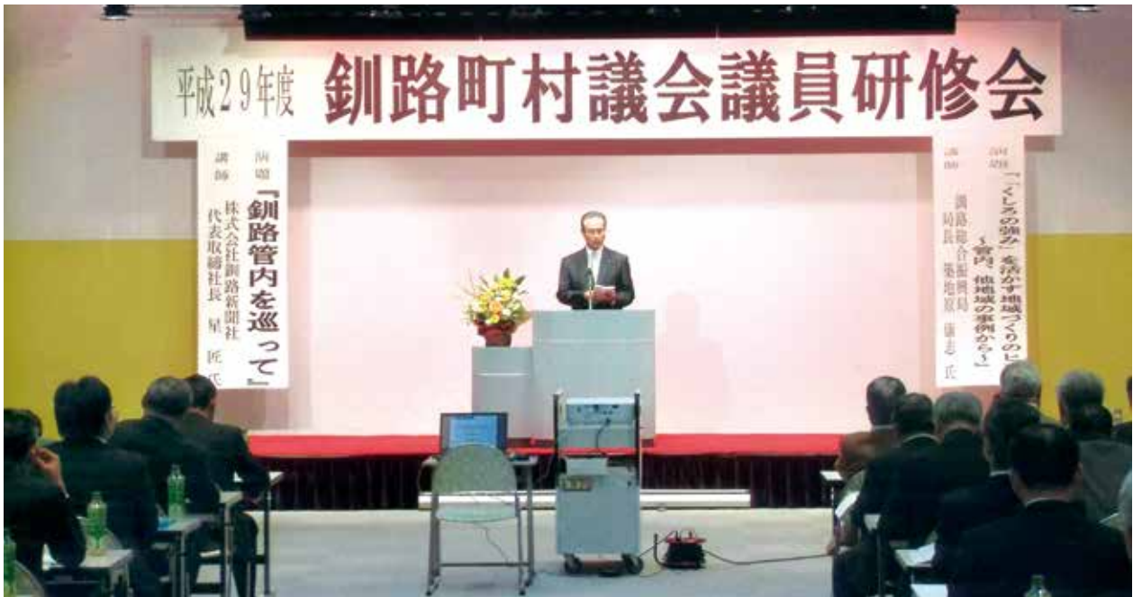
平成29年度 釧路町村議会議員研修会（11月7日）