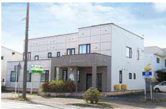
廃業した歯科医院