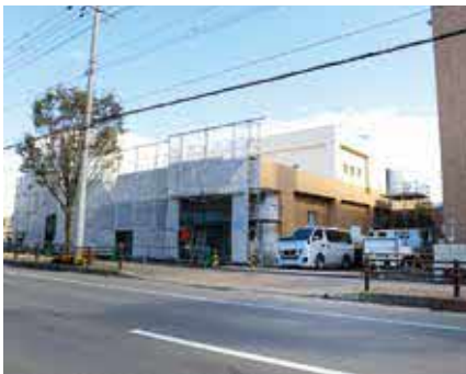
建設中の学校給食共同調理場

建て替えに伴い名称が「標茶町学校給食共同調理場」、位置が「標茶町川上1丁目25番地」に変更されました。