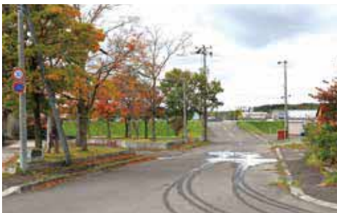
学童保育所に通じる道路

答 設置要請を関係機関に実施してきたが、横断歩道の必要性は認識しているものの、歩道の幅員が基準に適用しないことにより設置に至っていない。引き続き関係機関に要請することはもちろんだが、走行するドライバーに対し学童保育に通う子供たちがいることを認識していただき、横断注意などの看板が設置できないか検討している。