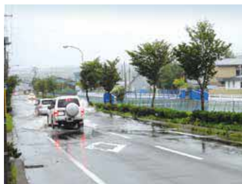
オモチャリ川の氾濫の様子