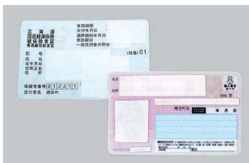
健康保険証とマイナンバーカード

マイナ保険証未取得者や必要ないと思っている人には、国では国民皆保険の主旨から必要な対応をすることで、詳細な取り扱いについては今後示されると思うので、それを踏まえ町民に対し丁寧に説明していきたい。