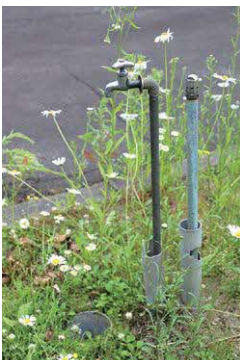
標茶霊園の水道施設

現状においては、再整備の考えは持っていないが、今後さらに利用実態を確認しながら検討していきたい。