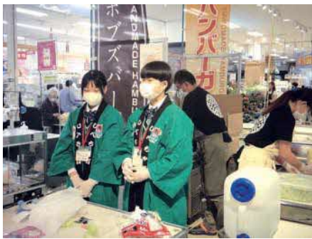
6月24日、25日の2日間、釧路市昭和イオンで「しべちゃフェア」が行われ、大盛況でした。標茶高校生も大活躍でした。