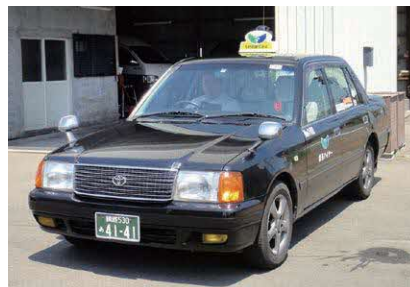
のりあいハイヤー