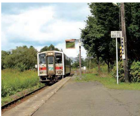
茅沼駅に入る列車

駅の維持管理費は、JR北海道では試算していないとのことだが、おむね1駅あたり1000万円から2000万円と聞いている。