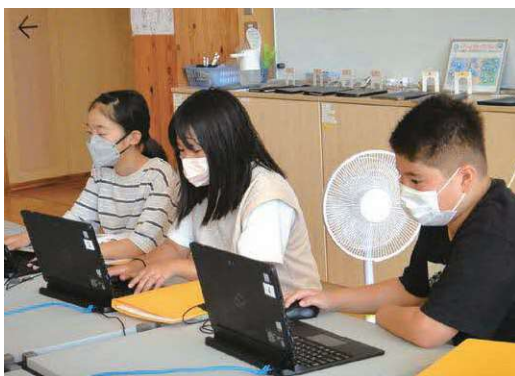
扇風機を回して学習

学校では、熱中症に関する危機管理マニュアルを作成し、教員間で共有しながら対応を進めている。