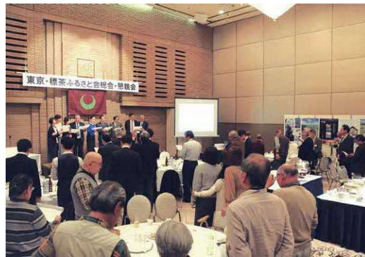
東京・標茶ふるさと会総会・懇親会