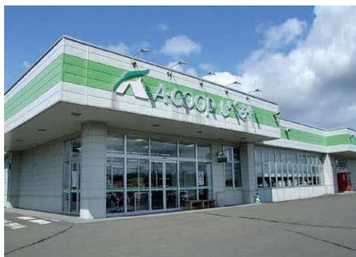
惜しまれて閉店・Aコープしべちゃ店

農協、商工会、町の理事者による今後の有効活用に係る協議を8月7日に実施している。物産センターとしての活用の協力を求められたほか、JA商品の販売、肉、魚介類を取り扱うことの可能性など意見交換をした。空き店舗の有効活用について、農協、商工会、町の三者で一番いい形にしていきたいと考えている。