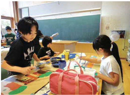
猛暑・小学校の学習

一人暮らしの高齢者に限らず、様々な場面で熱中症予防のため声掛け、健康状態の確認を行っている。学校でも湿度計測器の配備や対応策を検討していく。