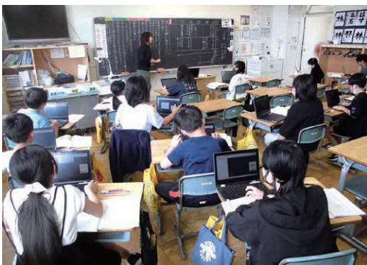
猛暑日の小中学生

近年、温暖化の影響により気温の高い日が増加してきているが、今後とも予断を許さない状況である。児童生徒の安全かつ健康的な学習環境を確保するためにエアコンの設置を検討すべきと考えるが所見を聞く。