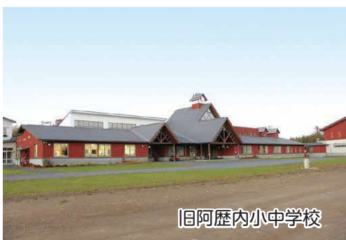
旧阿歴内小中学校

改修に併せて「Z E B」を導入することについては、施設の見学や、既存暖房と比較、費用の試算や補助制度の精査など、基本計画策定の準備を進めている。