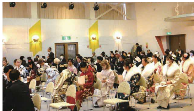
令和6年 20歳のつどい

世界的な食料危機が進行する中で、日本のカロリー自給率38%は先進国の中でも最低である。食糧自給率の向上を政府の法的義務とするよう求めたものです。