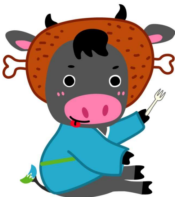
ハッピーくろべえ