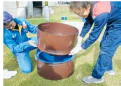
プランター加工例