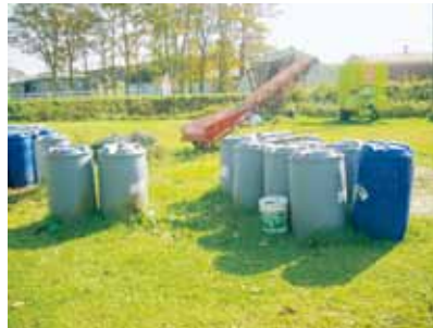
庭先や牛舎裏に放置されているという状況

フロンティア21では身近にできる『エコ』という題目でプロジェクト活動をしており、今年は牧草収穫時に出るギ酸タンクをどのように再利用するかというのが大きなテーマです。処理料が高いために農家の敷地内に置かれ、再利用されずに放置されているギ酸タンク…もったいないと思いませんか!?