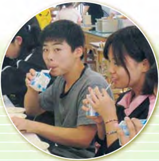
中茶安別小中学校

地元の牛から搾られた生乳100%の牛乳が町内の小中学校の子どもたちにおいしく飲まれています。今回は、町内小中学校の子どもたちがしべちや牛乳をおいしく飲んでいる様子を紹介します。