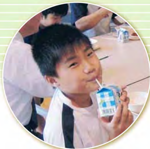
久著呂中央小中学校