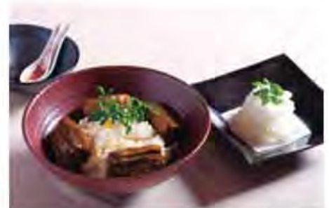
J-milk ホームページより提供