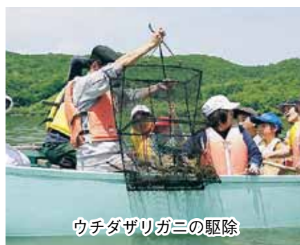
ウチダザリガニの駆除

動を行っています。 確かな学力の向上が、生きる力にきちんと結び付くために、そして、ふるさとを愛する子どもに結びつくよう、これからも教育活動を推進していきます。