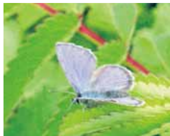
カラフトルリシジミ調査

気候や天候で生き物の確認は当たりはずれがあります。春先の雨の多さでキタサンショウウオの卵のうが流されたり、初夏の気温の低さに花の開花が遅れ、全道一斉調査の日に想定していた花を確認できなかったり、雨で調査が中止になったり、不連続だったようにも思います。しかし、その低温のおかげか、ゴトウアカメイトトンボが確認されたのは特筆すべきでしょう。