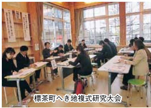
標茶町へき地複式研究大会

塘路小中学校は、平成22年度から、文部科学省の確かな学力の育成に係わる実践的調査研究校として「環境教育に関する取組を活用した調査研究」を行っています。