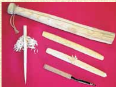
展示されるさまざまなアイヌ民具

雄大な西別岳と摩周湖の澄んだ伏流水が注ぐ西別川に抱かれた「虹別コタン」と広大な釧路湿原と塘路湖に豊かな資源を背景に栄えた「塘路コタン」の世界を、「古写真」と「アイヌ民具」にて紹介します。