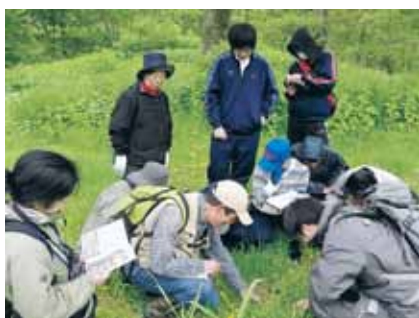
「北海道フラワースン2012」の様子

塘路湖で町の天然記念物ゴトウアカメイトトンボの撮影に成功！調査開始5年目での快挙でした。7月の半ばまで気温が低く、クロイトトンボなど他のトンボの数が増えてくる時期が遅れたため、見つけやすかったのだ