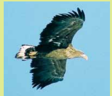
オジロワシ（尾の先にまだ子供の羽が残っています）

り、くちばしも黄色になっていきます。それまでははっきりしない模様なので、いったいなんのワシなのか悩まされることがしばしばあります。