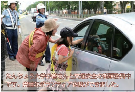
たんちょう大学の皆さんと交通安全の街頭啓発中です。貴重なボランティア体験ができました。

今年度は「一丸となって」がテーマです。徳・体・知の調和のとれた子どもを育てるため、家庭・地域のご理解・ご協力をいただきながら教職員が一丸となって教育活動を推進します。 ■分かる・できる授業 授業では、子どもたちが、「分かった」「できた」と実感し、学びがいを感じて自分から意欲的に取り組む姿を目指しています。授業を充実させるため、教員同士は積極的に授業を公開し、互いに学び合っています。 子どもの方かりに応じたきめ細やかな指導は、複数の教員による少人数指導で実施