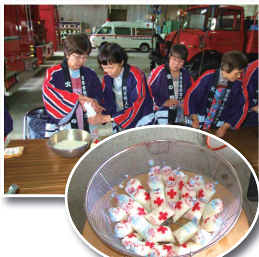
専用の米袋に入れて釜で炊きます

6月19日、標茶消防署車庫内にて標茶女性防火クラブが災害時を想定した炊き出し訓練を実施しました。この訓練では、炊き出し専用の米袋への米の詰め方や炊き出し要領を学びました。