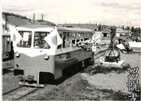
「簡易軌道標茶線 沼幌支線の開通式」

標茶にかつて存在していた鉄路は、釧網本線や標津線だけではなく、簡易軌道と呼ばれる標茶町営の鉄道がありました。簡易軌道はかつて殖民軌道と呼ばれ、人々や物資を乗せた台車を馬が運び、各地域を結びました。簡易軌道では馬の代わりにディーゼル機関車などを扱い、その役割を担いました。この写真は簡易軌道標茶線と呼ばれた、標茶中御卒別沼幌・上御卒別方面へ分岐した路線の写真です。沼幌支線開通記念の写真で、開運町の駅で撮影されました。なお当時標茶沼幌間の乗車料金は百十円でした。簡易軌道は昭和46年に廃止となっています。