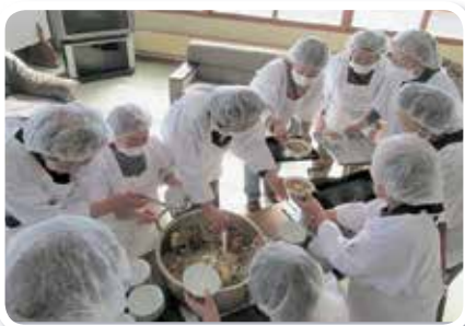
社会福祉協議会事業への協力