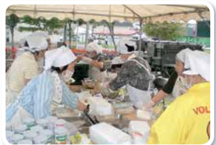
町防災訓練での炊出し訓練