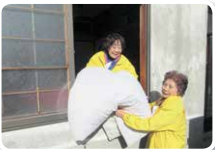
布団乾燥サービス