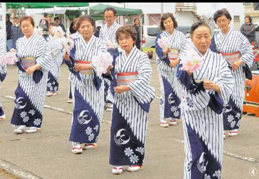
①毎年大人気のとうもろこし早むき大会②標茶熊牛まとい組によるはしご乗りの披露③標茶風太鼓による演奏④標茶音頭保存会による演舞⑤会場に出店した屋台を楽しむ子どもたち⑥夜には花火を一目見ようと多くの来場者が訪れた