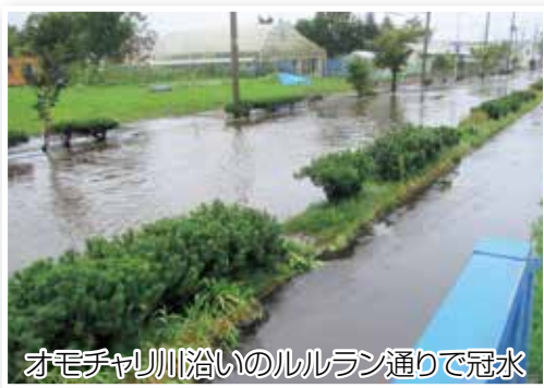
オモチャ川沿いのルルラン通りで冠水

昨年8月21～22日にかけて停滞した前線と台風11号の接近により総雨量、約195mmの大雨が本町を襲いました。大雨の影響で釧路川の水位が上昇し避難判断水位を上回ったため、桜・旭・平和・富士と麻生の一部、1152世帯2376人に避難勧告が出され、避難所へ744人の方が避難しました。この大雨の影響により、床下浸水が25件、道道3路線と町道7路線が一時通行止めになるなど影響がありました。