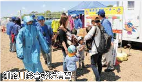
釧路川総合水防演習

今年度の標茶町総合防災訓練は実施しませんが、現在作成中の避難行動計画を用いた研修会を実施予定です。