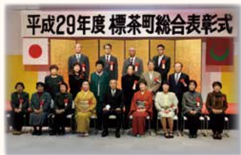
昨年の標茶町総合表彰式

いれば在住年数として数えます）不明な点は左記係に問い合わせください。 ■問い合わせ／役場総務課庶務係（2階⑬番窓口 ☎内線211）