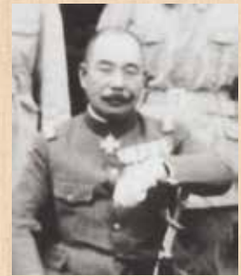
標茶で撮影された 遊佐幸平(1932年頃)

1932年（昭和7年）、遊佐は軍馬補充部川上支部長として標茶へ赴任するその年に、第10回ロサンゼルスオリンピックが行われます。遊佐は馬術競技の日本代表監督として臨みました。