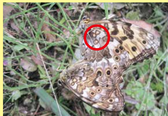
ヤマキマダラヒカゲ

この3つの丸が、サトは直線かゆるやかなカーブを描くようにならんでおり、ヤマは「くの字」に見えるような並びになっていることが多いです。ただし、この3つの丸の並びにも個体差がありますので、ほかの見分けポイントも見て、総合的に判断するのが一般的な判別方法です。