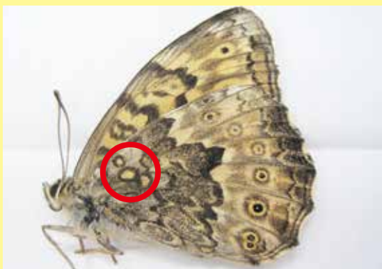
サトキマダラヒカゲ

見分けるポイントはいくつかありますが、比較的わかりやすいポイントが写真の中、赤丸で囲ってある部分です。