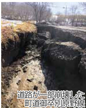
道路が一部崩壊した 町道御卒別原野線