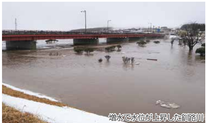
増水で水位が上昇した釧路川

3月10～11日にかけて、発達した低気圧の通過に伴う大雨と融雪により、釧路川の水位が、氾濫危険水位22.50mに近い、22.39mまで上昇しました。11日の早朝には桜・旭・平和・富士・麻生・多和の一部地域、1,192世帯2,410人に、緊急性・危険性が高い「避難指示（緊急）」が発表されました。この大雨の影響で、JR釧網線の運休や道道クチョロ原野塘路線・中標津標茶線の一部などが通行止めとなり、現在も交通への影響が続いています。