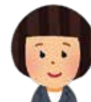
健康推進係 保健師