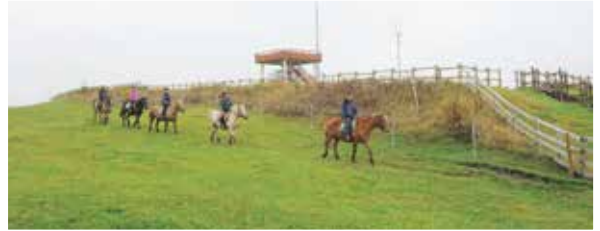
多和平コースでのホーストレッキングの様子はNHKにも取材され朝の番組で紹介されました。

今後、宿泊施設や乗馬サービス事業者さんが増えれば、さらに多くの乗馬ファンが訪れる町になると思います。