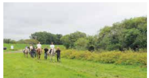
令和元年9月8日(日)産業まつりにて。引馬体験は大盛況で子どもも大人も皆笑顔でした。

標茶町は乗用馬生産の歴史が息づく町です。この地域で人と馬が共に暮らし、さらに新しい産業を興すことができれば、とても素晴らしいことだと確信しています。