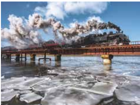
フォトコンテスト作品 (令和2年冬・金賞)