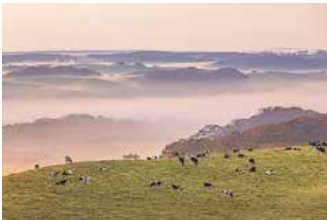
フォトコンテスト作品 (令和元年夏・標茶賞)

釧網本線維持活性化沿線協議会の取り組みの一つとして、観光客の取り込みを目的としたフォトコンテストを開催しました。釧網線を利用し