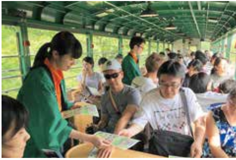
くしろ湿原ノロッコ号

含む沿線自治体では「釧網本線維持活性化沿線協議会」を立ち上げ、維持活性化に向けてさまざまな取り組みを行っています。