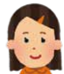
子育て支援センター 保育士