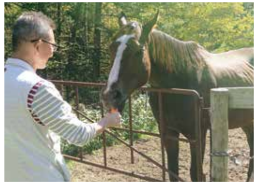
馬預かり事業の受け入れ第1号のショコラ。道東の冬を2回超えて、とてもたくましくなりました。

また、馬の飼養預託事業を推進するため、平成30年から、ふるさと納税を活用する取り組みを始めました。初年度はクラウドファンディング型で約400万円、2年目の昨年度はクラウドファンディング型と一般のふるさと納税（馬目的使用分）を合わせて約1,100万円の寄付をいただくことができました。標茶町の馬を核とした地域振興の取り組みに、全国から多くの期待を寄せていただいています。