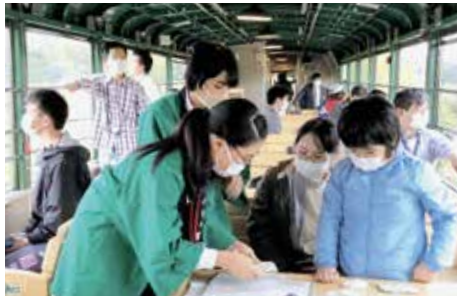
10/3 高校生が観光客をおもてなし

くしろ湿原ノロッコ号が川湯温泉駅まで延長運転をし、釧路駅から標茶駅の区間で、標茶高校ガイドゼミの生徒が乗客に、湿原などの自然環境やノロッコ号の歴史をPRしました。標茶駅では生徒が捕獲したエゾシカを加工したジャーキーの試食のほか、キーホルダーやプレスレットなどを販売しました。ガイドを終えた生徒たちは「ガイドを行ったことで新たな気づきや知識を得られました。もっと多くの方にガイドをしてみたい」と話していました。