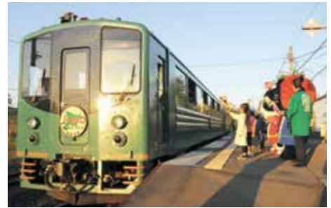
9/28~30 夕陽ノロッコ号が運行

くしろ湿原ノロッコ号が川湯温泉駅まで延長運転をし、釧路駅から標茶駅の区間で、標茶高校ガイドゼミの生徒が乗客に、湿原などの自然環境やノロッコ号の歴史をPRしました。標茶駅では生徒が捕獲したエゾシカを加工したジャーキーの試食のほか、キーホルダーやプレスレットなどを販売しました。ガイドを終えた生徒たちは「ガイドを行ったことで新たな気づきや知識を得られました。もっと多くの方にガイドをしてみたい」と話していました。