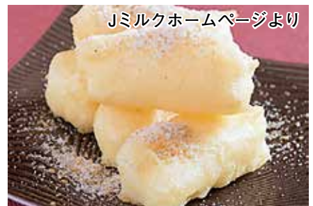
Jミルクホームページより