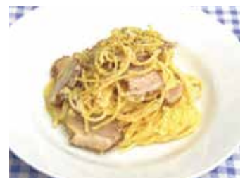
Jミルクホームページより