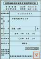
限度証 (限度額適用認定証)

引き続き減額認定証と限度証の交付対象に該当する方は、保険証と合わせて郵送します。新たに必要となる方は、交付要件に該当することを確認の上、役場住民課年金保険係へ申請してください。