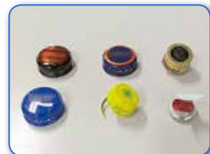
缶類のふた・瓶類のキャップ