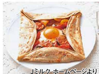
Jミルク ホームページより