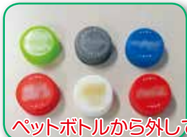
ペットボトルから外して「プラスチック類」へ