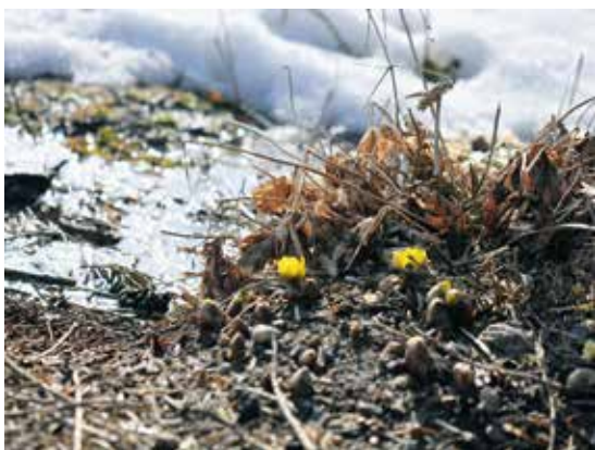
賀東 嘉廣さん（桜）の作品 「2月28日の花笑み」