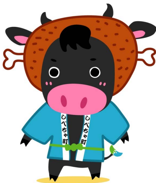
(ハッピーくろべえ)